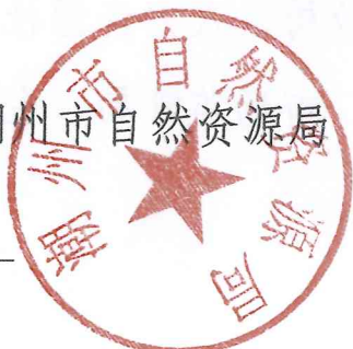
潮州市自然资源局