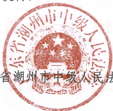
广东省潮州市中级人民法院

为全面贯彻落实党的二十大精神，推进营商环境改革，充分发挥破产审判职能，助力发挥市场在资源配置中的决定性作用，推动潮州经济社会高质量发展，市法院、市发展改革局、市财政局、市人力资源社会保障局、市自然资源局、市住房和城乡建设局、市国资委、市市场监管局、市金融局、市政务服务数据管理局、市税务局、人民银行潮州市中心支行、潮州银保监分局联合制定了《关于建立企业破产工作府院联动机制的实施意见》，现印发给你们，请结合实际认真贯彻执行。