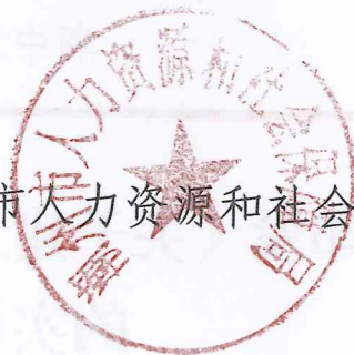
潮州市人力资源和社会保障局