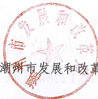
潮州市发展和改革委员会