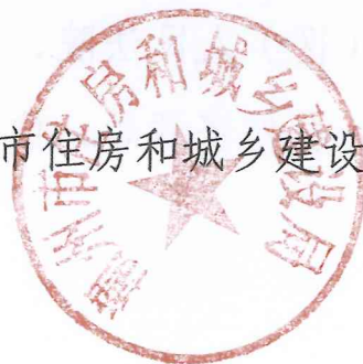
潮州市住房和城乡建设局